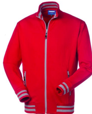
07 – ROUGE