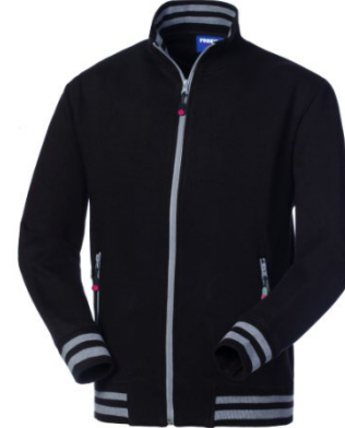
12 – GRIS