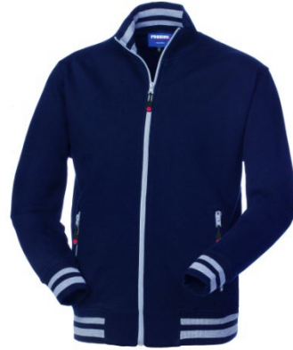
01 – BLEU