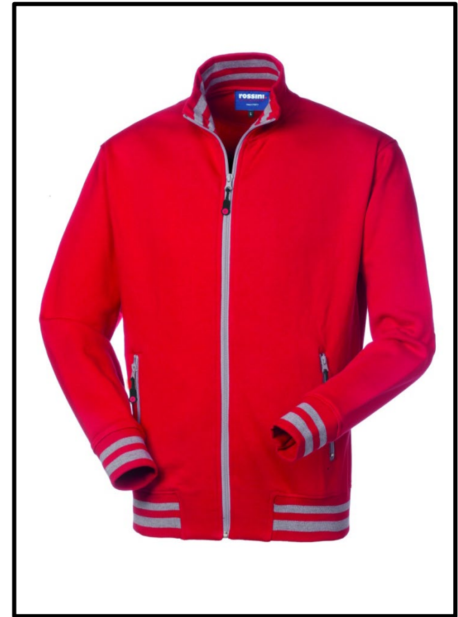
07 – ROUGE