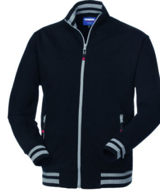
05 – NOIR