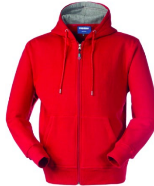
07 – ROUGE