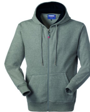
12 – GRIS MELANGE'