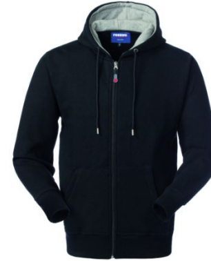
05 – NOIR