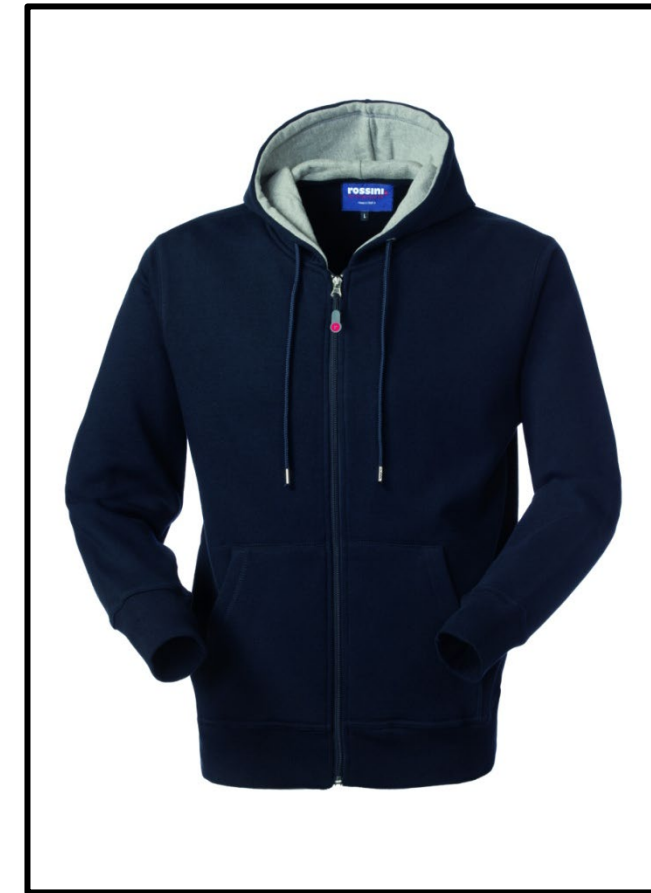
01 – BLEU