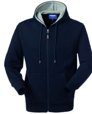
01 – BLEU