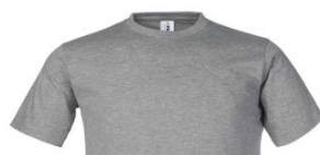
12 – GRIS MÉLANGÉ