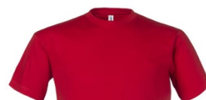
07 – ROUGE