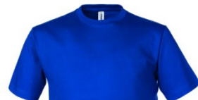
06 – BLEU CLAIR ROYAL