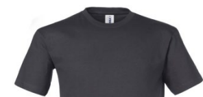
16 – ANTHRACITE