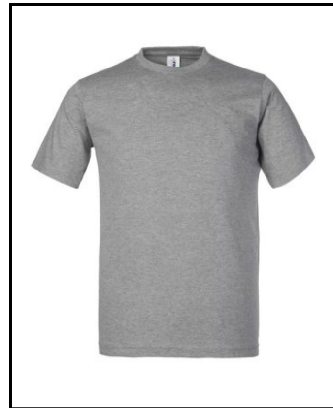
12 – GRIS MÉLANGÉ