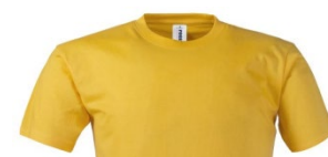
08 – JAUNE