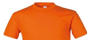
09 – ORANGE