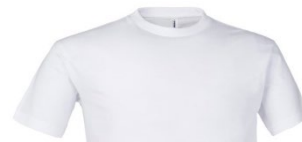
02 – BLANC