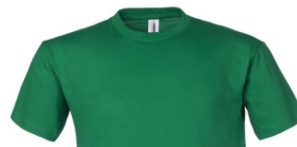
41 – VERT POMME