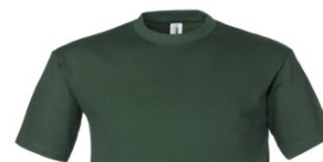
51 – BOTTLE GREEN