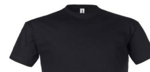
05 – NOIR