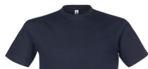
01 – BLEU

4XL, 5XL uniquement en 01-bleu, 02-blanc, 05-noir, 12-gris mélangé